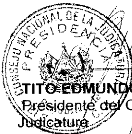
TITO EDMUNDO ZELADA MEJIA Presidente del Consejo Nacional de la Judicatura